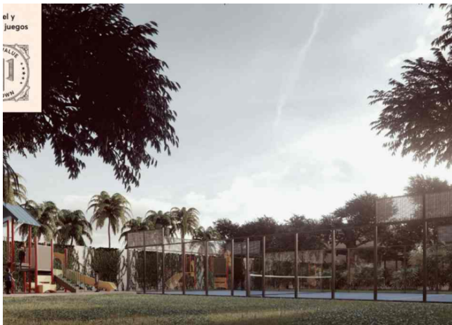
Deportes y juegos