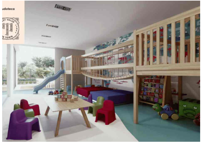
Deportes y juegos