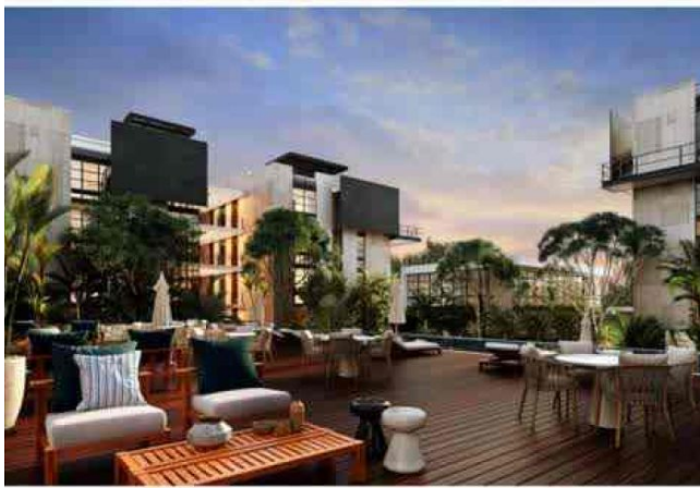
reas verdes y comunes.