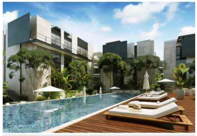
reas verdes y comunes.