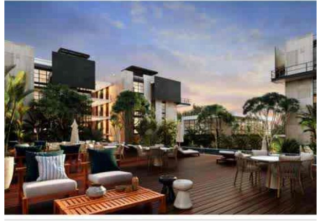
reas verdes y comunes.