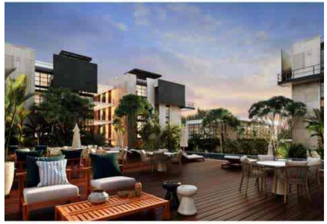
reas verdes y comunes.