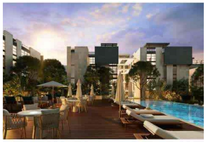
OOF TOP (Terrace)